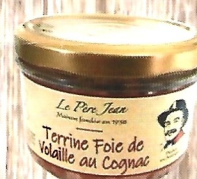
Terrine foie de volaille au Cognac