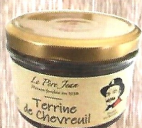
Terrine de Chevreuil