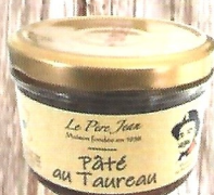
Terrine de Taureau