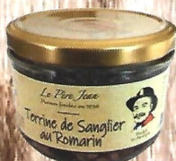
Terrine de Sanglier au Romarin