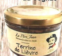
Terrine de Lièvre

Terrines en 180 g date de conservation : de 2 à 3 ans.