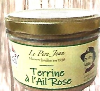
Terrine à l'Ail Rose