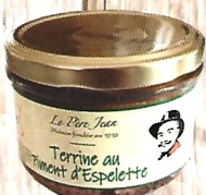
Terrine au Piment d'Espelette