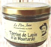
Terrine de Lapin À la Moutarde