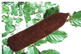
Pur porc fumé