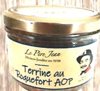
Terrine Paysanne au Roquefort