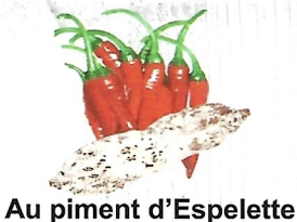
Au piment d'Espelette