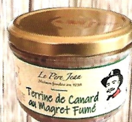
Terrine de Canard au magret fumé