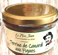
Terrine de Canard aux Figues