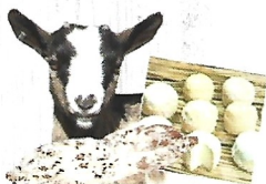
Au fromage de chèvre