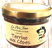
Terrine aux Cèpes