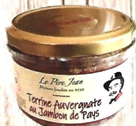
Terrine Auvergnate Au jambon de Pays