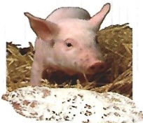
Nature pur porc