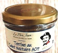
Terrine au St Nectaire